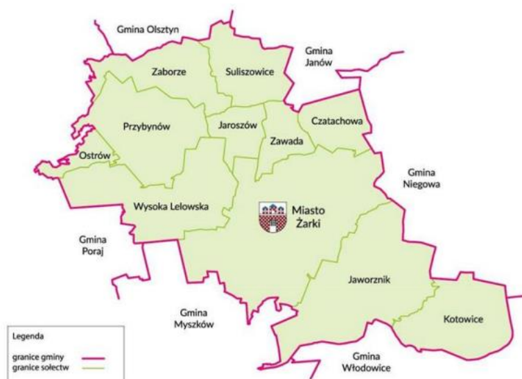
Rysunek 1. Granice terytorialne Gminy Żarki

Powierzchnia gminy wynosi 101,1 km 2 i podzielona jest na 10 sołectw : Jaworznik, Kotowice, Suliszowice, Zawada, Czatachowa, Jarosów, Wysoka Lelowska, Przybynów, Ostrów i Zaborze. Miasto Żarki podzielone jest na 5 osiedli (Leśniów i Przewodzisowice, 600-lecia, Centrum, Częstochowska i Olesiów). Liczba mieszkańców gminy na dzień 31.12.2022 r. wyniosła 8274 osób.