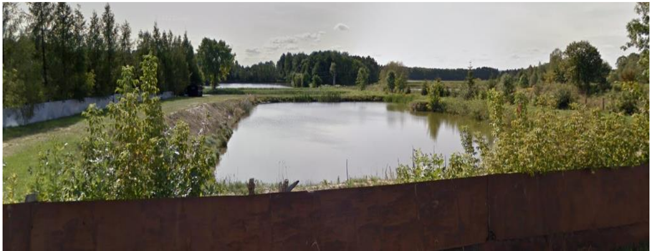
Rysunek 7. Stawy przy ul. Kieleckiej w Jaworzniku