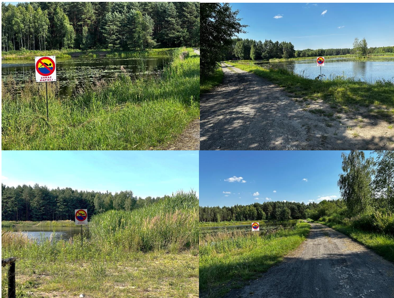
Rysunek 9. Stawy w sołectwie Jaworznik (Masłoń, Gorzkowce) zarządzane przez PZW Okręg Częstochowa

Ministra Spraw Wewnętrznych z dnia 6 marca 2012 r. w sprawie sposobu oznakowania i zabezpieczania obszarów wodnych oraz wzorów znaków zakazu, nakazu oraz znaków informacyjnych i flag (Dz. U. z 2012 r. poz. 286 z późn. zm.).