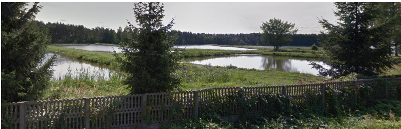
Rysunek 8. Stawy przy ul. Myszkowskiej w Jaworzniku