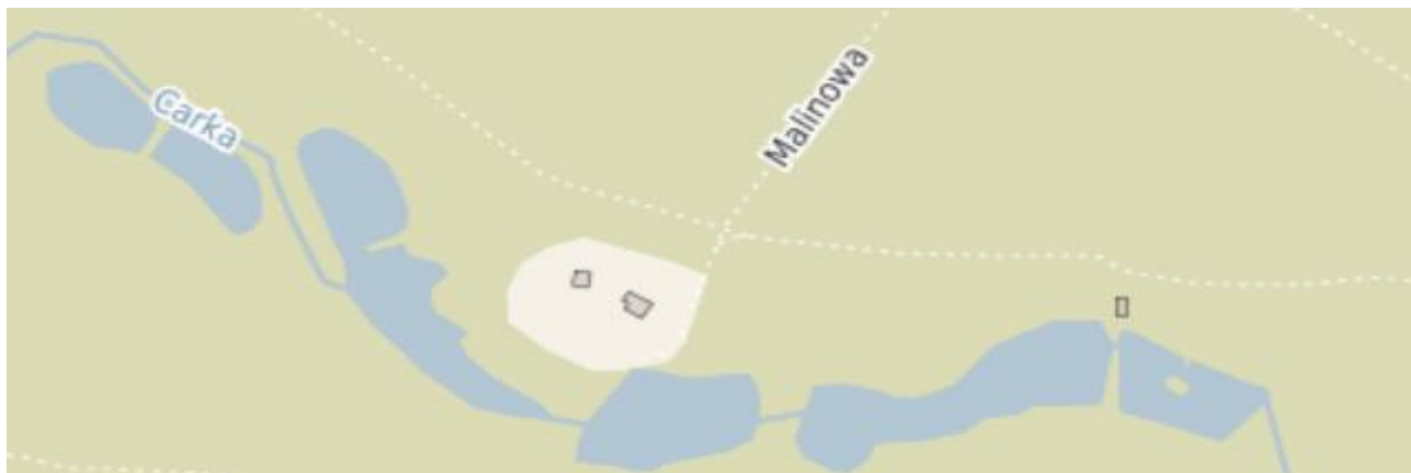
Rysunek 5. Stawy w sołectwie Wysoka Lelowska (Czarka)