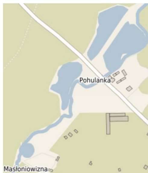
Rysunek 4. Stawy w sołectwie Zaborze