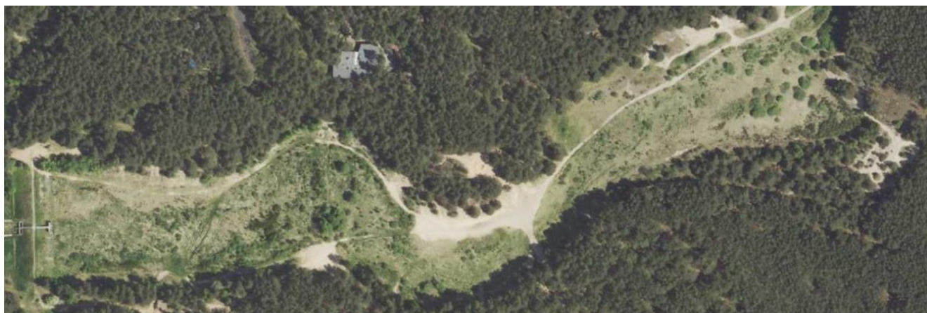
Rysunek 2. Widok na zbiornik w Zaborzu z lotu ptaka

Zbiornik wodny w Zaborzu powstał w latach 70. na skraju osady o nazwie Skrobaczowizna. Zbiornik zasilany był cyklicznie co kilka lat przez potok zwany „Sucha Woda” lub „Ordonka”. Naturalną dolinę otoczoną lasami, przez którą przepływał potok, zamknięto zaporą z przepustem, tworząc zbiornik wodny. Ostatni raz źródła wypełniły zbiornik w 2010 r. W wyniku uwarunkowań naturalnych funkcja retencyjna zbiornika zanikła (zjawiska krasowe). Zbiornik od wielu lat jest suchy. Teren zbiornika oraz teren wokół porośnięty jest bujną roślinnością i drzewami.