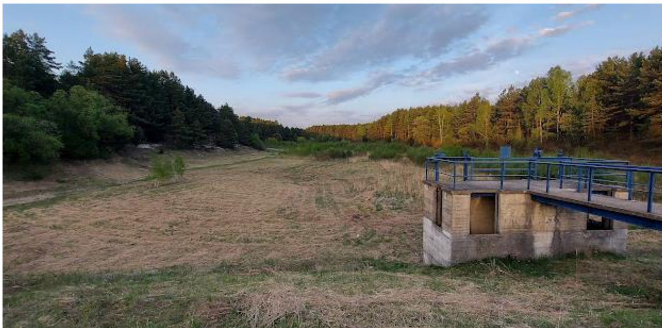
Rysunek 3. Obecny widok na zbiornik w Zaborzu